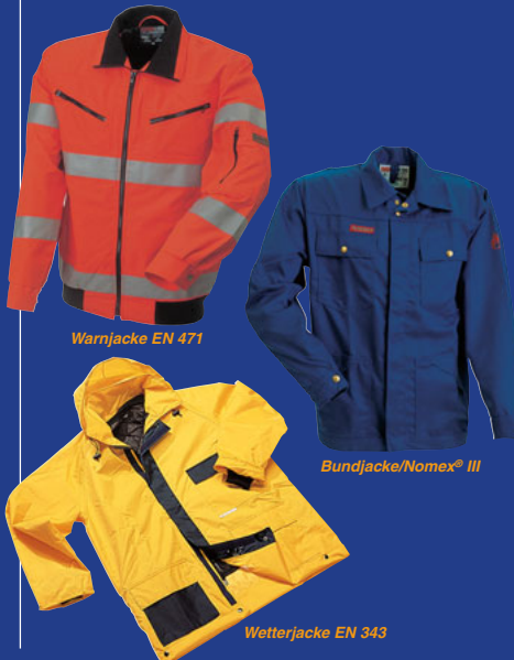
Warnjacke EN 471

Die Schutzkleidung wird bei Arbeiten in Gefrierhäusern getragen. Um optimalen Schutz zu bieten, muss die Bekleidung als Anzug (Parka, Latzhose, Blouson oder Overall) getragen werden. Weiterhin entsprechende Kopf- und Handbedeckung sowie Schutzschuhe. Bei dem Prüfverfahren nach EN 342 wird die Wärmeisolation sowie die Luftdurchlässigkeit getestet. Das Piktogramm gibt Auskunft über den Grad der Schutzwirkung. Die Zahlen, die sich darunter befinden, bedeuten z.B. 0,529 (B) gemessene resultierende Grundwärmeisolation, bei stehender Tätigkeit, sehr leichter und mittlerer Belastung.