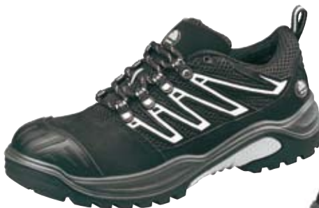
TRAXX® 209 S1P Art.-Nr. 81669769