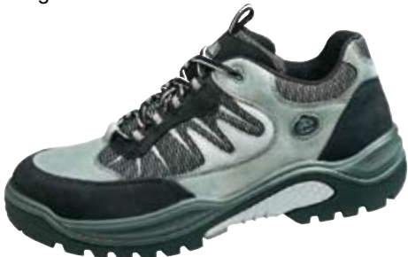
TRAXX® 21 S1 Art.-Nr. 81623653