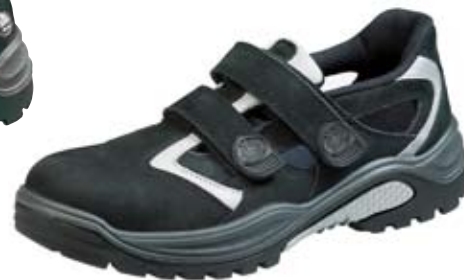
TRAXX® 27 S1 Art.-Nr. 83663668

Bata Industrials verwendet für seine Schuhe ausgesprochen atmungsaktive Materialien, zum Beispiel Textil und Nubuk für das Obermaterial und das feuchtigkeitsabsorbierende Bata Cool Comfort® und Bata VentAir® für das Innenfutter. Die beiden letztgenannten Materialien bestehen aus verschiedenen Lagen, die für ein angenehmes trockenes und frisches Gefühl sorgen und gleichzeitig die Feuchtigkeit sicher nach außen abführen. Die Wirkung dieses Klima-Managements kommt erst dann richtig zur Geltung, wenn auch die Socken Wärme und Feuchtigkeit aufnehmen und weiterleiten können, so dass diese anschließend über das Innenfutter und Obermaterial abgeleitet werden können. Hierfür sorgt Pro-Guards®, ebenfalls eine Eigenentwicklung von Bata Industrials.