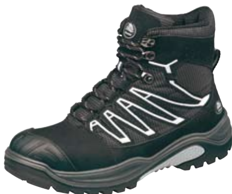
TRAXX® 210 S1P Art.-Nr. 80669770