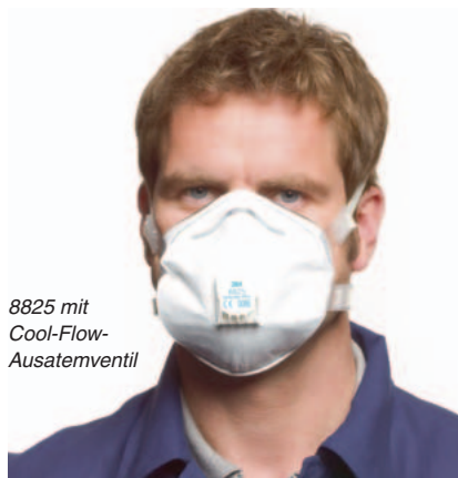
8825 mit Cool-Flow-Ausatemventil

3M 8825 Schutzstufe FFP2D Einsatzlimit: 10facher Grenzwert Art.-Nr. 8825