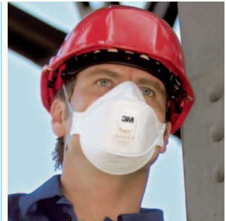
9322 mit Cool-Flow-Ausatemventil und Schutzhelm 1465R

Alle Masken entsprechen der Europäischen Norm EN 405: 2001 und tragen das CE-Zeichen.