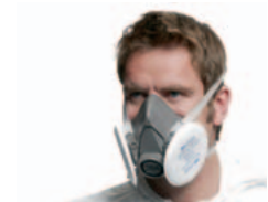
Halbmaske mit Partikelfilter 2125 – Wartungsarm