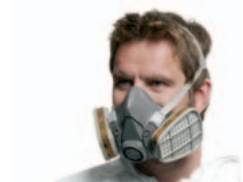
Halbmaske mit Gas- und Kombifilter 6051 – Wartungsarm