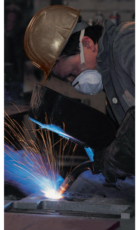
9928 mit Cool-Flow-Ausatemventil

Alle Masken entsprechen der Europäischen Norm EN 405: 2001 und tragen das CE-Zeichen.