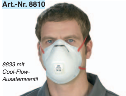
8833 mit Cool-Flow-Ausatemventil

3M 8812 Schutzstufe FFP1 Einsatzlimit: 4-facher Grenzwert