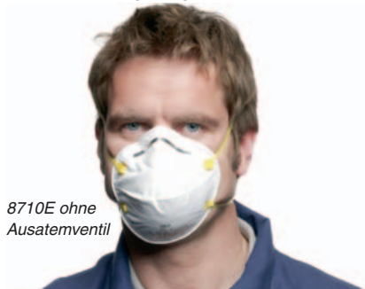
8710E ohne Ausatemventil

3M 8710E Schutzstufe FFP1 Einsatzlimit: 4-facher Grenzwert