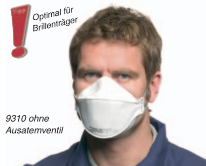
9310 ohne Ausatemventil

3M 9310 Schutzstufe FFP1 Einsatzlimit: 4-facher Grenzwert