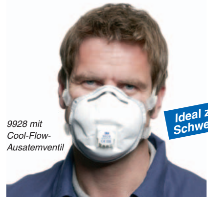
9928 mit Cool-Flow-Ausatemventil