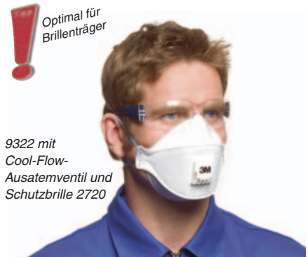
9322 mit Cool-Flow-Ausatemventil und Schutzbrille 2720

3M 9312 Schutzstufe FFP1 Einsatzlimit: 4-facher Grenzwert