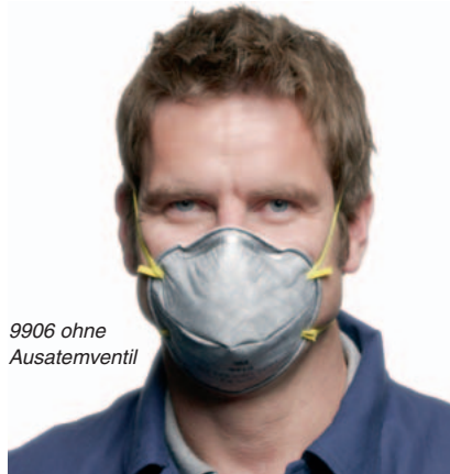
9906 ohne Ausatemventil

Mit integrierter Aktivkohleschicht für zusätzlichen Schutz und reduzierter Geruchsbelästigung.