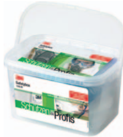
Optimal beim Schleifen, Kleben und Lackieren.