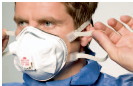
8835 mit Cool-Flow-Ausatemventil

3M 8835 Schutzstufe FFP3D Einsatzlimit: 30-facher Grenzwert. In zwei Größen erhältlich (S/M, M/L) Art.-Nr. 8835